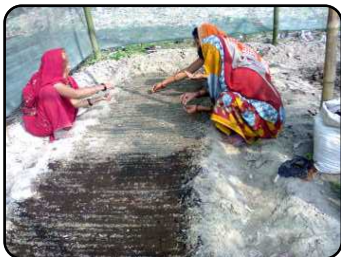
Single Window System at the Doorstep of Small and Marginal Farmers

The most innovative aspect of JEEViKA's implementation has been the creation of a single window system for small and marginal farmers at their doorstep, which provides all services within 2 kilometers of the farmer's house. Implementation of various interventions through community-based organization led to the creation of a single window system.