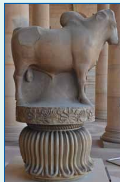
At Rashtrapati Bhavan, New Delhi

The logo is Rampurva Bull, a part of the ancient Ashokan Pillars. Ashokan Pillars are the most celebrated example of Mauryan Art. Rashtrapati Bhavan houses the magnificent third century B.C. sandstone capital of the Ashokan Pillar known as the Rampurva Bull. It gets the name from the site of its discovery, Rampurva in Bihar. The Rampurva Bull is mounted on a pedestal between the central pillars at the Forecourt entrance of the Rashtrapati Bhavan. The Rampurva Bull is noted for its delicately sculpted model demonstrating superior representation of soft flesh, sensitive nostrils, alert ears and strong legs. It is a mixture of Indian and Persian elements. Whereas the motifs on the base, atop the inverted lotus, the rosette, palmette and the acanthus ornaments are not Indian features, the bull capital is a masterpiece of Indian craftsmanship. Weighing up to five ton, this invaluable artifact became a part of Rashtrapati Bhavan in the year 1948. This was at the initiative of Dr. Rajendra Prasad and Pandit Nehru who took keen interest in this priceless piece of history and decided that it would remain at the Rashtrapati Bhavan instead of being shifted to the newly constructed National Museum building which had come up at Janpath in the year 1960.